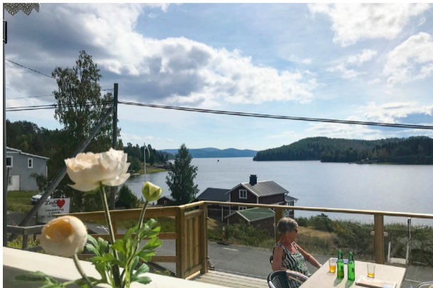
Lövviks Restaurang & Café, som har säsongsoppet.