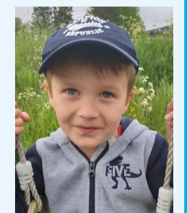
Andreas, Backen Torrom: – Att det finns en affär och den ser ut som ett magasin.