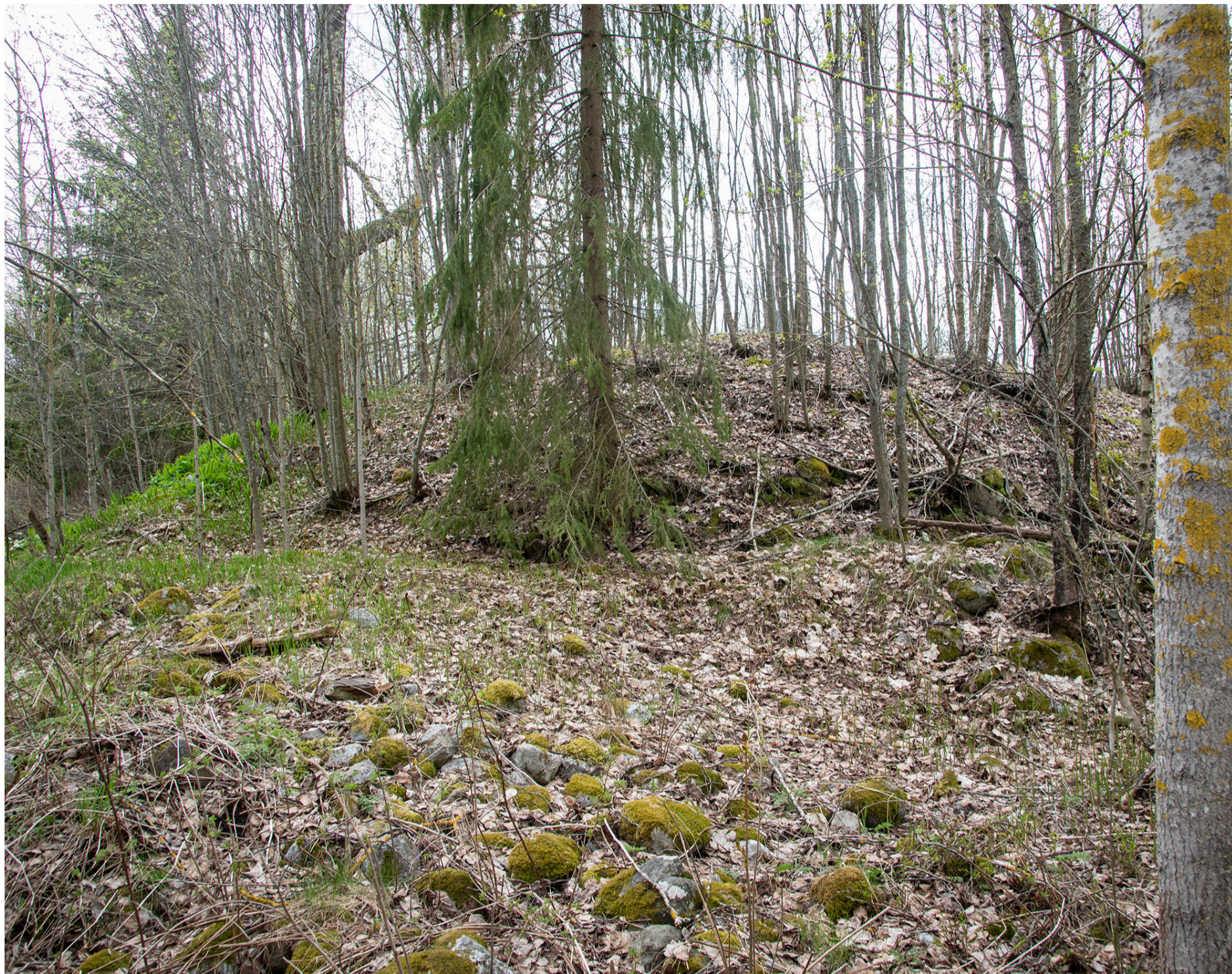
Holshögen är en av de största gravhögar från järnåldern. Den är två meter hög och mäter 18 meter i diameter.