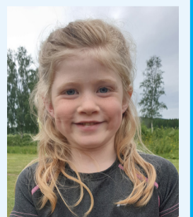
Tilde, Skullersta: – Att det är fint här och att det finns många kompisar här.