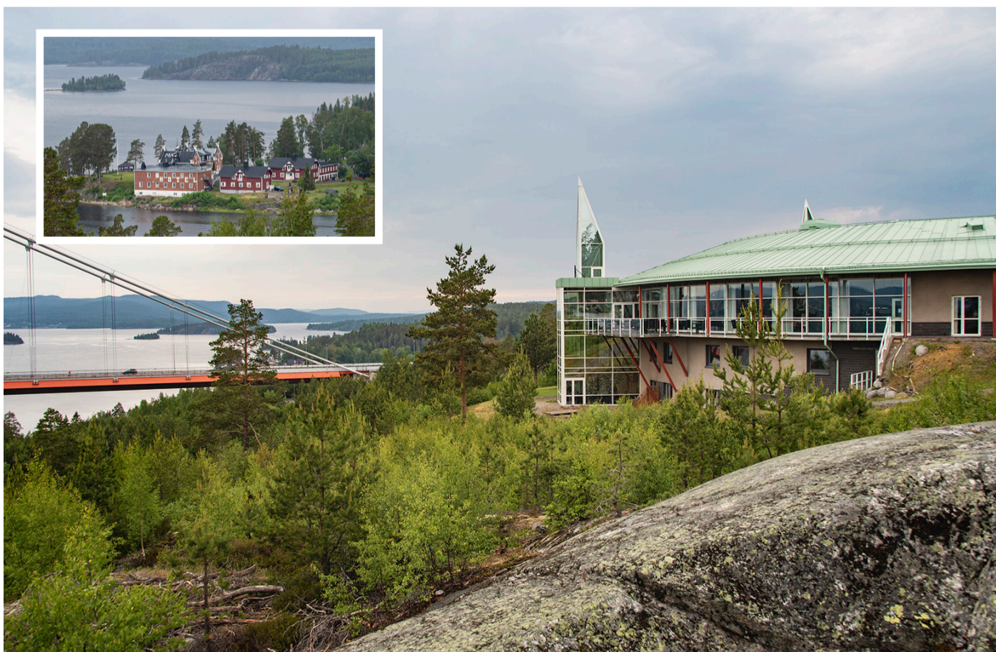
Hotell Höga Kusten och Hotell Björkudden är de två första anläggningarna en turist möter i södra änden av världsarvet.