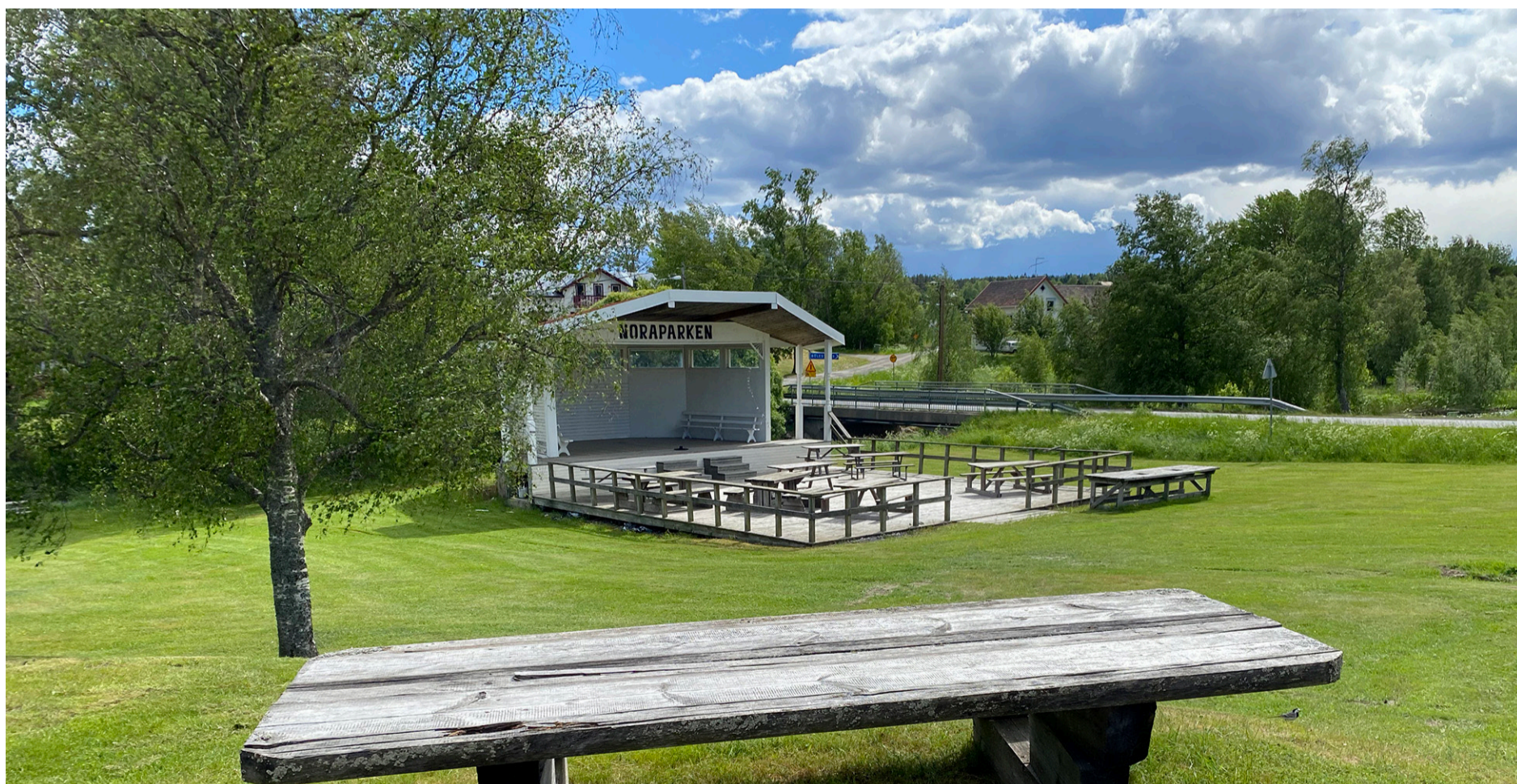
Noraparken har stått utan verksamhet under pandemin, men i år när den fyller 30 år, blir det äntligen framträdanden!

Somriga hälsningar från oss i Noramacken!