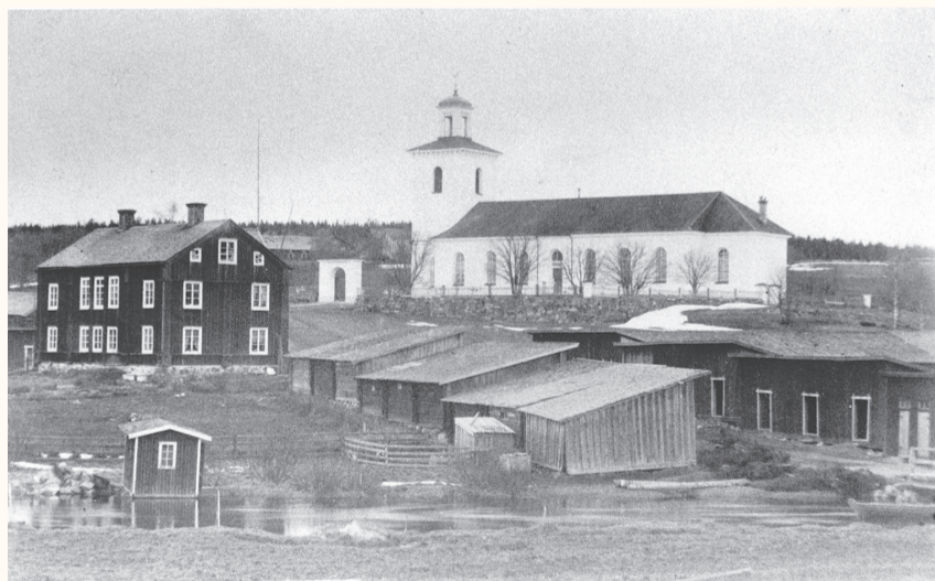
Kyrkstallarna nedanför kyrkan. Fotot är från 1890-talet. Bilden och uppgifterna i artikeln är hämtad från Tore Ramströms artikel om Kyrkstallar i Nora 2012.

Numera är storstallet verkstad och förråd för Nora församling.