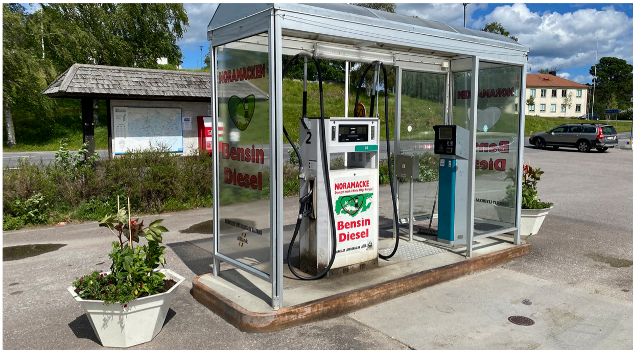
Noramacken började med längtan efter en mack och blev en samlad kraft i bygden.