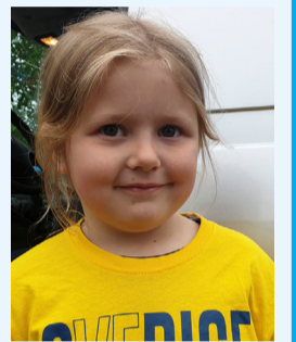
Freja, Svartnora: – Det finns så snälla människor här.

Vad är det som är bra med att bo i Nora?